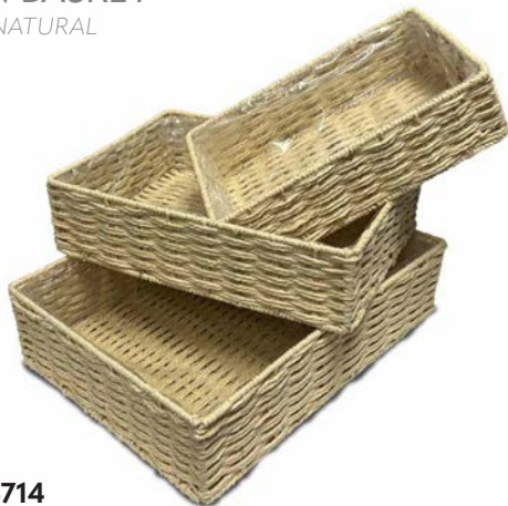
803-714 15¾" X 12" X 4" SET (3), CS (10SET3)