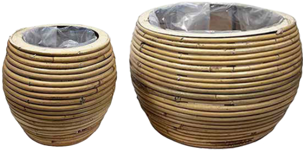
803-705 8"-4" SET (2), BTE (24SET)