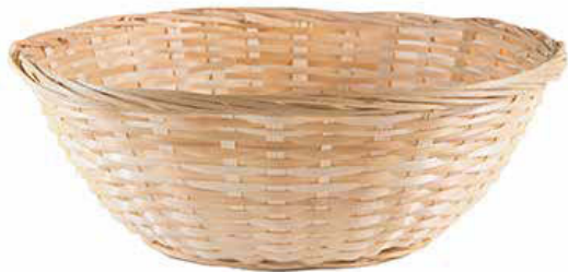
801-019 12" X 3 1/2" (HK12) UNI