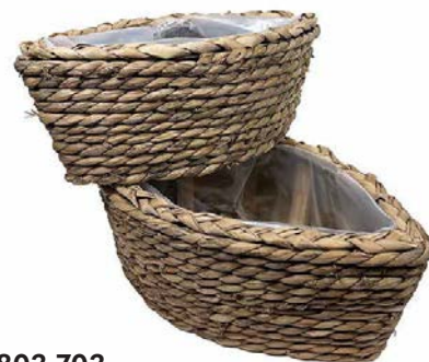
803-703 12¼"X6½" / 9½"X4¾" SET (2), BTE (24SET)