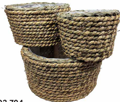
803-704 Ø 8"-6"-4" SET (3), BTE (32SET)