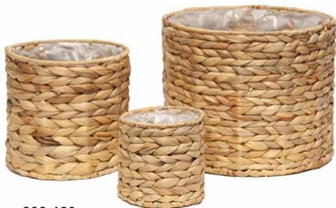
803-630 Ø 10½" - 7½" - 4¾" SET (3), CS (12SET)