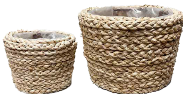
803-700 8"-5" SET (2), BTE (24SET)