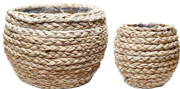
803-702 8"-4" SET (2), BTE (24SET)