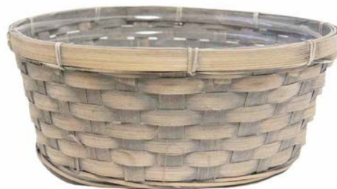
803-650 12" X 5" (30x13CM) UNI