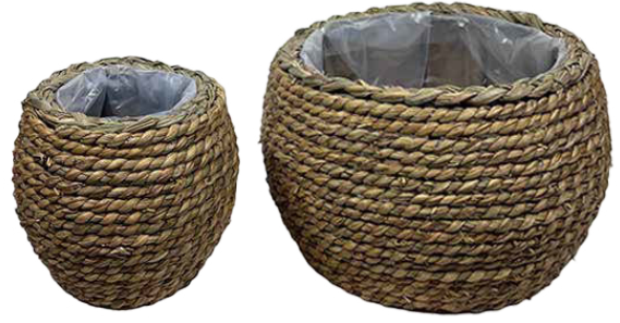
803-701 8"-4" SET (2), BTE (24SET)