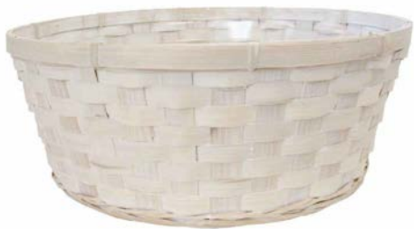
803-589 12" X 5" (30x13CM) UNI