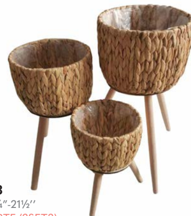
803-713 Ø12"-18¾"-21½" SET (3), BTE (2SET3)