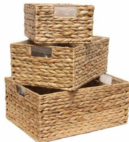
803-608 16½" - 14½" - 12½" SET (3), CS (8SET)