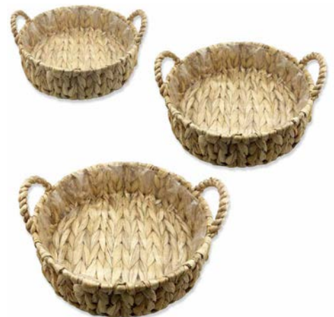
803-715 Ø 10½"-12¼"-13¾" SET (3), CS (12SET3)